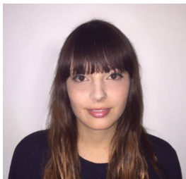
安娜·玛利亚德拉·帕拉